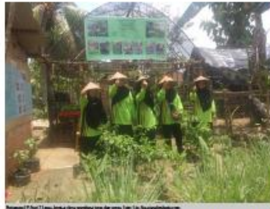
Berbagai PT Aset 2 Limau bentuk desa penghasil toga dan sorga.

Senin, 07 Oktober 2019 - 16:45 WIB | Penulis: Sigit Santoso | Editor: Sigit Santoso