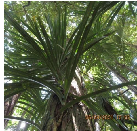
Gambar 1. Macaranga hispida dan Tutukus